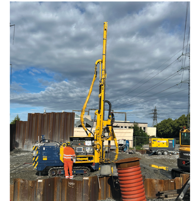
Kalksementpeler er én av teknikkene som brukes for å oppnå økt områdestabilitet.

Resultatene fra arbeidet skal gjøres tilgjengelig for fagmiljø, lokalsamfunn, og som bidrag i utdanning.